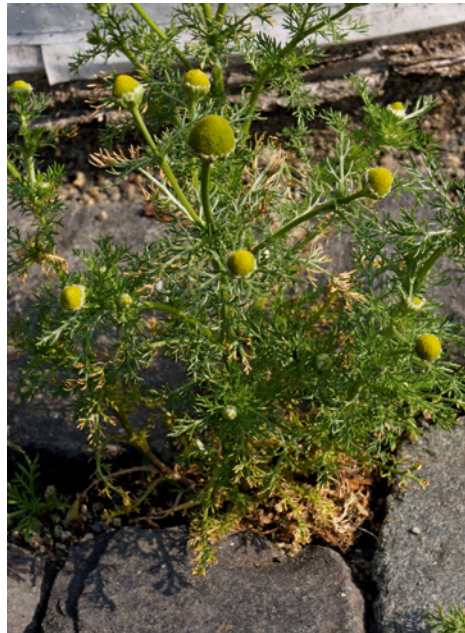
Abb. 4: Matricaria discoidea (Strahlenlose Kamille).