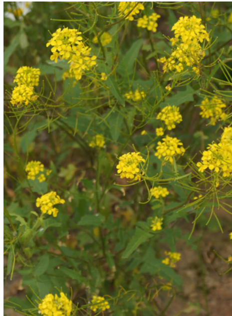
Abb. 8: Baumscheibe mit Sisymbrium loeselii (Loesels Rauke).