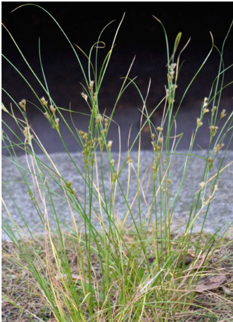
Abb. 3: Juncus tenuis (Zarte Binse).