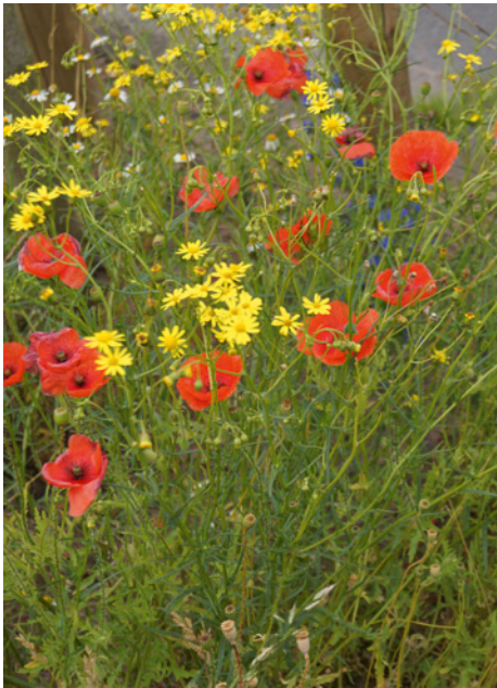
Abb. 7: Baumscheibe mit Senecio inaequidens (Schmalblättriges Greiskraut), Papaver rhoeas (Klatsch-Mohn) und Echium vulgare (Gewöhnlicher Natterkopf).

Muscari neglectum , Myosotis sylvatica , Narcissus tazetta , Phytolacca acinosa , Securigera varia , Tulipa gesneria , Viola x wittrockiana .