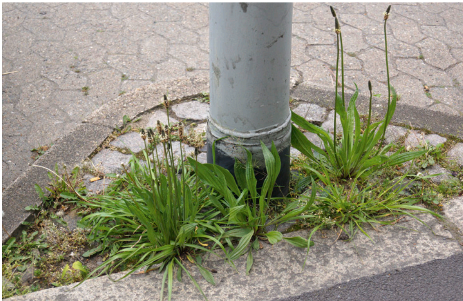
Abb. 1: Wenig betretenes Kleinpflaster an einer Parkbucht mit Plantago lanceolata (Spitz-Wegerich).

Dort, wo Gehwege direkt an Hauswände oder Mauern grenzen, macht sich ein Spalier-effekt bemerkbar, der noch von Nährstoffeintrag (Hundekot und -urin) sowie von verminderter Trittentensität überlagert wird. Im Innenstadtbereich finden sich an diesem Standort vor allem Conyza canadensis , Galinsoga parviflora , Hordeum murinum , Lactuca serriola , Poa annua , Sagina procumbens oder Stellaria media , seltener auch Dip-