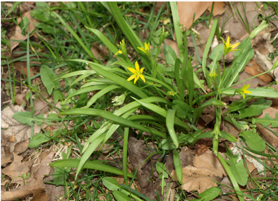
Abb. 6: Gagea lutea (Wald-Goldstern) auf dem Mittelstreifen einer Allee.

Bereits mit der Pflanzung von Straßenbäumen werden Diasporen von Pflanzen eingeschleppt, ebenso mit Abdecksubstraten, gelegentlich mit der Bepflanzung der Baumscheiben durch Anwohner oder auch mit widerrechtlich deponierten Abfällen. Lange bekannt und mehrfach untersucht wurden Vorkommen von Hordeum murinum auf innerstädtischen Baumscheiben. Hordeum murinum gilt als „Stadtpflanze“ (WITTIG