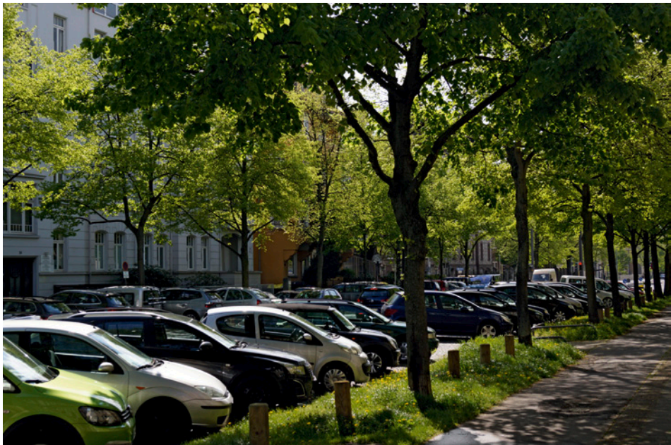
Abb. 5: Baumstreifen mit spontanem Bewuchs.

Nur auf Baumscheiben und Baumstreifen (Abb. 5) kann auf oberflächen-versiegelten Straßen der Niederschlag versickern. Hierdurch wird sowohl der Abfluss verringert als auch zur Grundwasserneubildung beigetragen. Beides sind wichtige Ökosystemleistungen in der Stadt. Gerade auf Böden, die von Pflanzenwurzeln durchwachsen werden, erfolgt die Versickerung sehr effektiv. Spontan bewachsene Baumscheiben werden von manchen Bürgern, vor allem aber in den Medien oft als Ärgernis eingestuft. Diese offensichtliche Fehleinschätzung wird von einer Umfrage in fünf europäischen Städten eindeutig widerlegt (KOWARIK et al. 2016). Demnach wissen die Bürger in Berlin die Biodiversität von Baumscheiben durchaus zu schätzen.