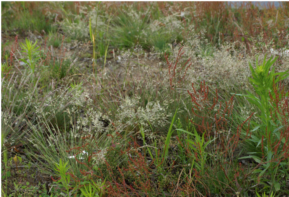
Abb. 11: Sandtrockenrasen mit Corynephorus canescens (Silbergras), Rumex acetosella (Kleiner Sauerampfer) und Conyza canadensis (Kanadisches Berufkraut).

Die Besiedlung der Stadtbahntrassen durch Pflanzen wurde als Modell für eine Neubesiedlung des Schotterbettes und seiner Randbereiche jeweils aus den angrenzenden Flächen gewertet (Brandes 2005), da eine Einschleppung aus dem Gleisnetz des Deutschen Bahn aus folgenden Gründen weitgehend ausgeschlossen werden kann: