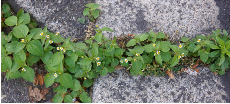
Abb. 2: Gasse und Bordstein-Fuge als ‚safe site‘ für Galinsoga ciliata (Behaartes Knopfkraut).

Die Artenzahlen der spontanen Flora steigen bei vergleichbaren Straßen mit deren Länge signifikant an (Brandes 2010).