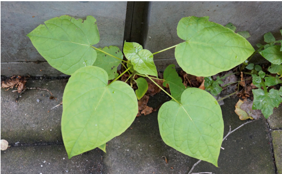
Abb. 10: Catalpa bignonioides (Gewöhnlicher Trompetenbaum): Jungwuchs eines seltenen Straßenbaums.

Acer platanoides , Acer pseudoplatanus , Acer saccharinum , Aesculus hippocastanum , Ailanthus altissima , Catalpa bignonioides (Abb. 10), Corylus colurna , Fraxinus excelsior , Fraxinus ornus , Ostrya carpinifolia , Platanus x hispanica , Populus x canadensis , Quercus rubra , Sorbus intermedia , Tilia platyphyllos , Tilia sp.