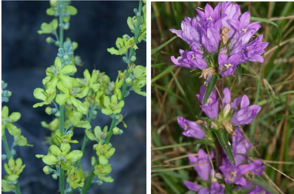
Abb. 5: Verbascum lychnitis und Campanula glomerata (2005).

Thalictrum minus Thymus pulegioides Verbascum chaixii ssp. austriacum Verbascum lychnitis Vincetoxicum hirundinaria