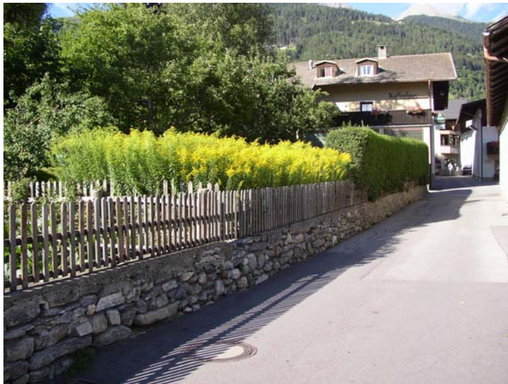
Abb. 8: Kultur von Solidago canadensis in einem Garten in Matriei i. O. (2004).