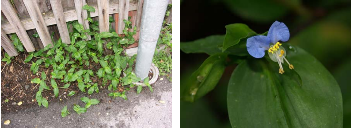
Abb. 7: Commelina communis in Matrei i. O. (2005).