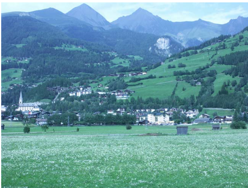
Abb. 1: Blick auf Matriei in Osttirol (2005).

Die Marktgemeinde Matriei liegt in einer Meereshöhe von ca. 975 m und ist die zweitgrößte Landgemeinde in Tirol. Um die Charakteristika der Siedlungsvegetation herauszuarbeiten, wurde nur der relativ dicht bebaute Ortskern (ca. 0,8 km 2 ) kartiert; die zum heutigen Gemeindegebiet gehörenden Ortsteile, Weiler und Einzelhöfe wurden nicht berücksichtigt. Die Checkliste umfasst Funde zwischen 1997 und 2005 aus dem dicht bebauten Ortskern. Sie strebt Vollständigkeit bei der Erfassung der Ruderal- und Adventivflora an und dokumentiert zugleich den Artenbestand nach vorläufigem Abschluss der Transformation von einem auch landwirtschaftlich geprägten Markort zu einem stark touristisch überprägten Wohn- und Dienstleistungsort, der bereits weitgehend städtische Schönheitsideale auf den gepflegten Grundstücken der Einfamilienhäuser übernommen hat. Die öffentlich zugänglichen Flächen sind heute weitgehend versiegelt, die Zierrabatten sind mit Rindenmulch abgedeckt.