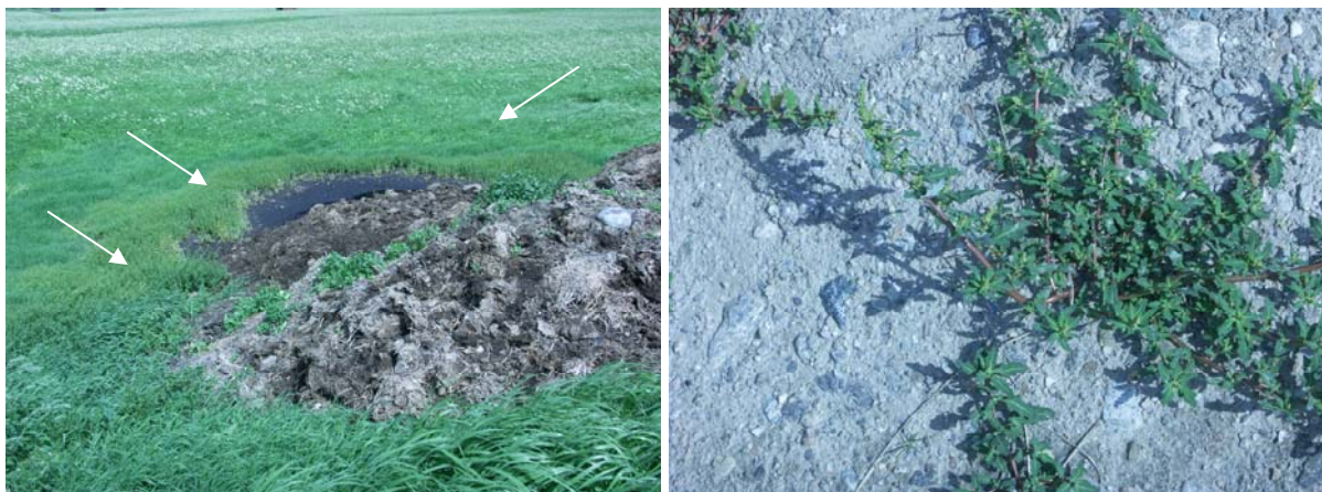
Abb. 3: Chenopodium glaucum am Ortsrand von Matri i. O. (2005).

Polygonum lapathifolium subsp. lapathifolium