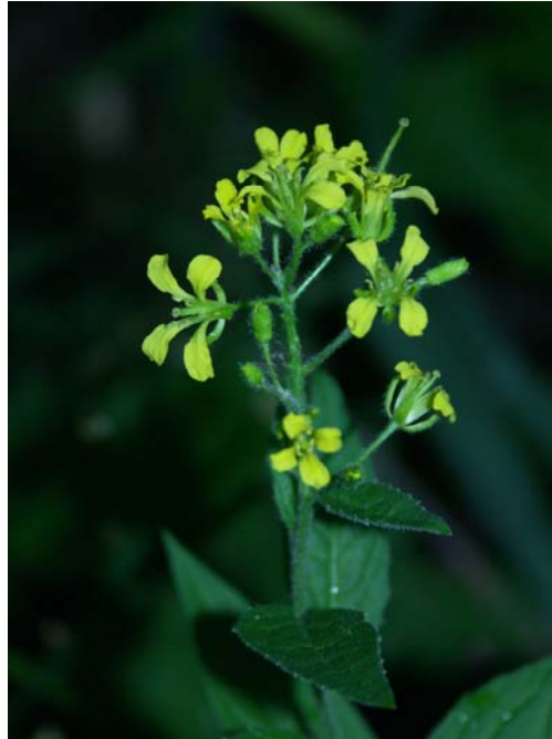
Abb. 2: Sisymbrium strictissimum im Ortsgebiet von Matri in Osttirol (2005).

deutlicher Rückgang festzustellen ist. Der Verband Arction stellt in der Matrier Ortslage die zweitwichtigste Gruppe der Klasse Artemisietea dar. Besonders hervorzuheben ist, dass sich Chenopodium bonus-henricus trotz des Rückgangs der Landwirtschaft gut behaupten kann. Von den nitrophilen Saumgesellschaften (Glechometalia) sind die häufigen Vorkommen des Sisymbrium strictissimi Brandes in Mucina 1993 bemerkenswert.