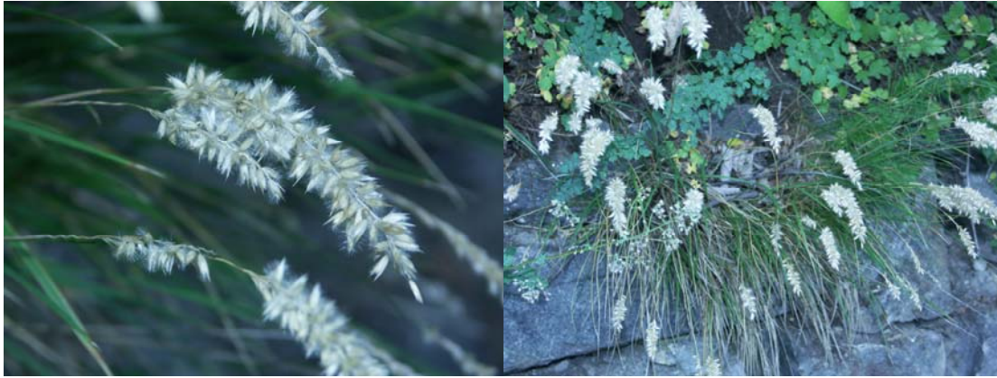
Abb. 6: Melica ciliata im Ortsgebiet von Matri in Osttirol (2005).

Anmerkung: Sedum reflexum ist vermutlich aus Anpflanzungen verwildert; die Art fehlt offensichtlich im Iseltal.