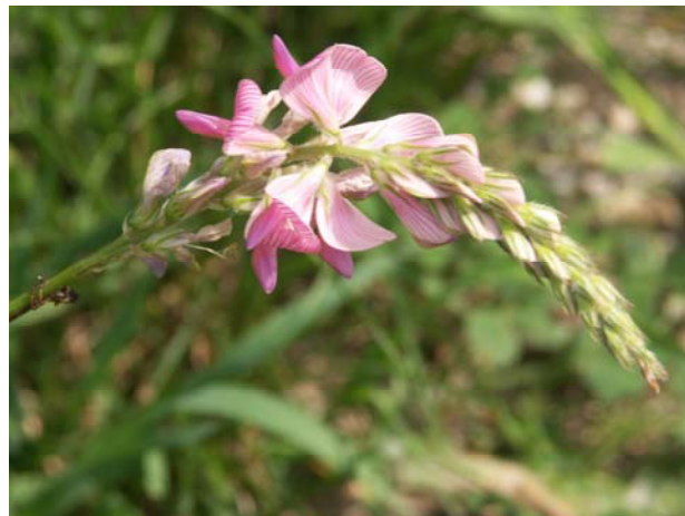
Abb. 4: Onobrychis viciifolia in Matri i. O. (2005).

Pimpinella major Plantago lanceolata Plantago media Poa pratensis Poa trivialis Prunella vulgaris Ranunculus acris Rumex acetosa Symphytum officinale Taraxacum officinale agg. Tragopogon pratensis Trifolium hybridum Trifolium pratense Trifolium repens Trisetum flavescens Vicia cracca