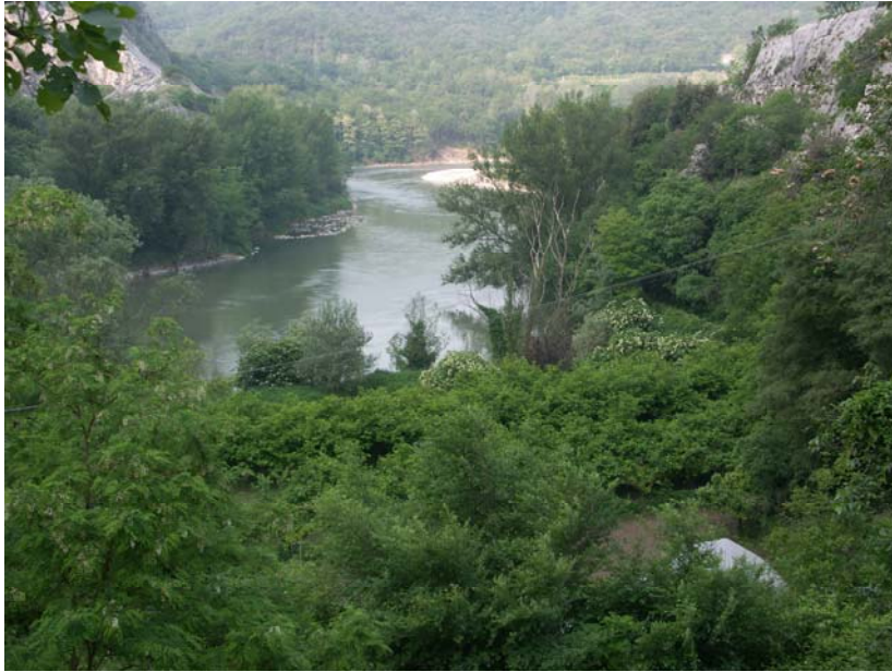
Steilufer bei Ceraino (2005)