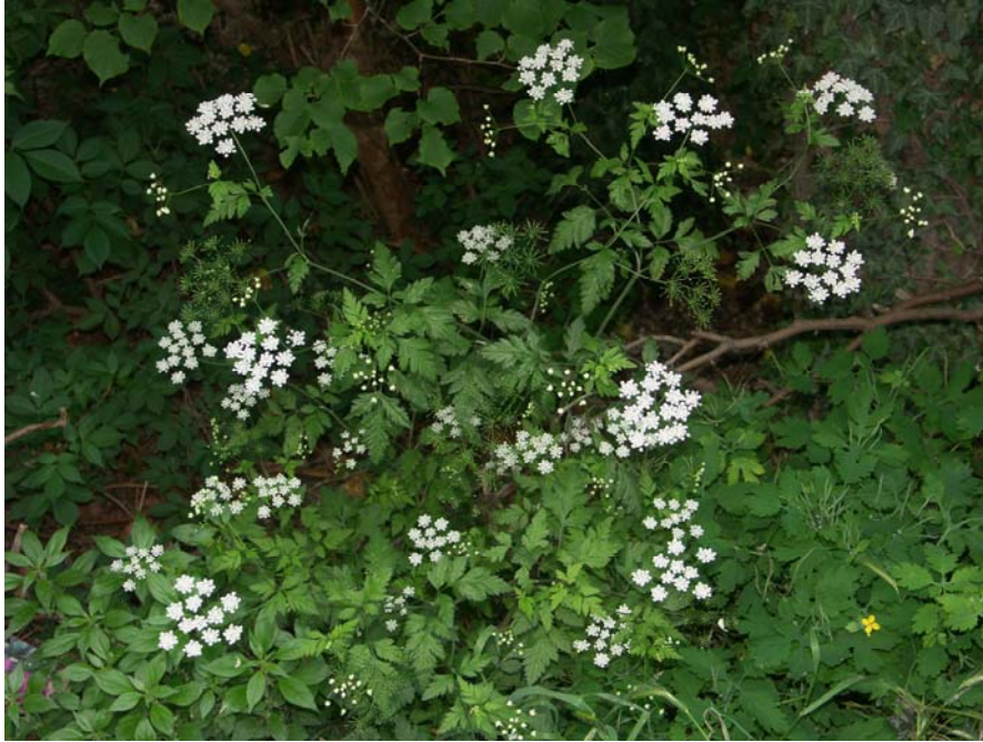
Chaerophyllum temulum am Etschufer bei der Veroneser Klause/Chiusa Veneta (2005)

Chaerophyllum temulum Chiusa Veneta 2005