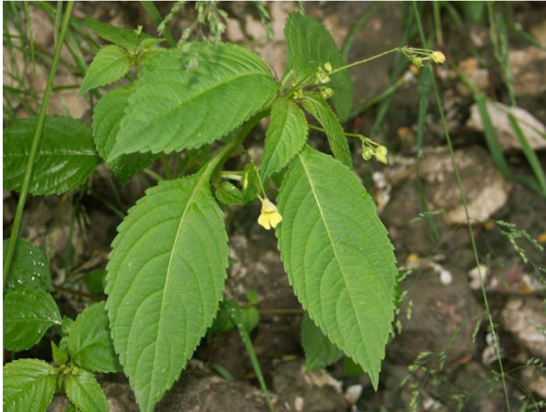
Impatiens parviflora am Etschufer südlich Preabocco 2005